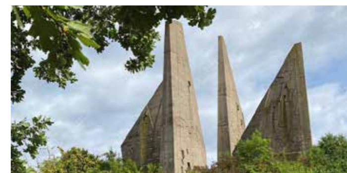
Das Heimkehrerdenkmal in Friedland.

Infos zum Konzept Erinnerungskultur unter: www.landkreisgoettingen.de/erinnerungskultur