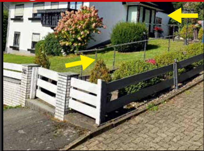
Handlauf Zuwegung zu Ihrer Haustür