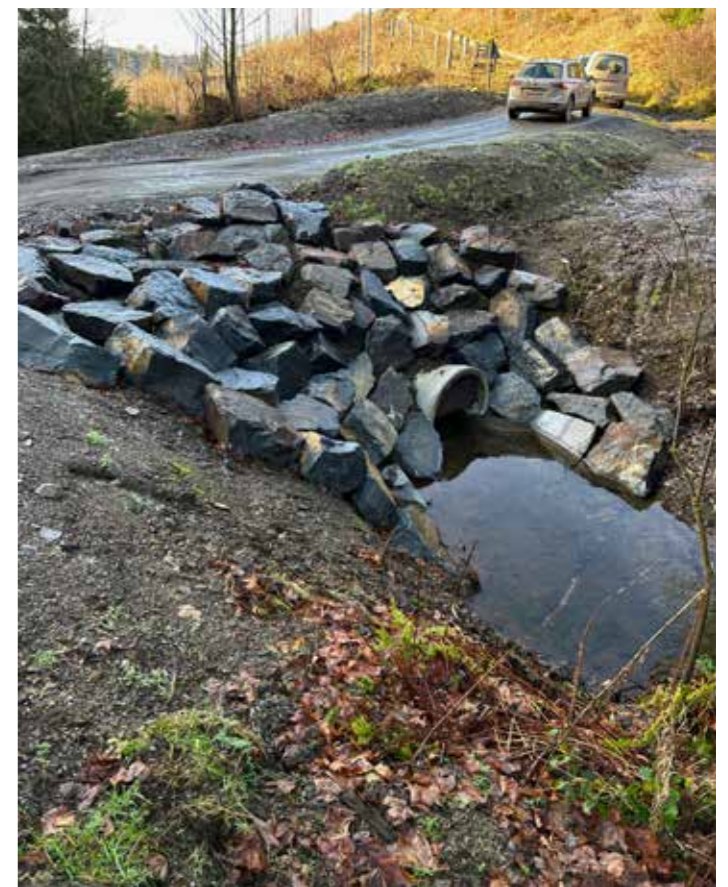
Bauwerk mit Rückhaltefunktion

Gerade für Lerbach und Freiheit ist das Pilotprojekt ein wichtiges Signal. Die Stadt Osterode am Harz dankt den Landesforsten für die engagierte Umsetzung und die konstruktive Zusammenarbeit, die einen maßgeblichen Beitrag zu einem nachhaltigen Umgang mit Wasser und Wald leistet.