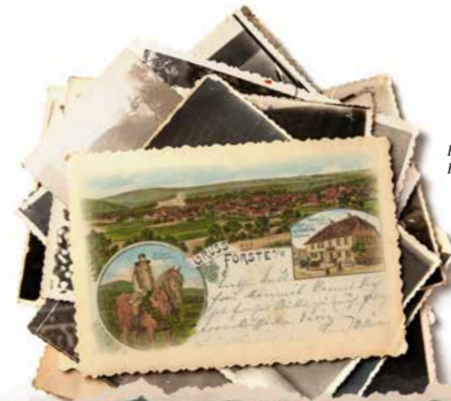
Kranzreitjunge, Förster Postkarte um 1900

"Holle, Bolle, Tolle! Eck weit woll, wat eck wolle! Heir rei (reite) eck op'n Hoff, Kaiser un de Bischof, Kaiser un de Könning, dat Land leg in Plönnig. Sticke wise Vugreläi maket jou Nestre rane. Hahne un de Hinne seiten ob'n inne, Katte un de Mous leipen ob'n tau'n Fast raout!"