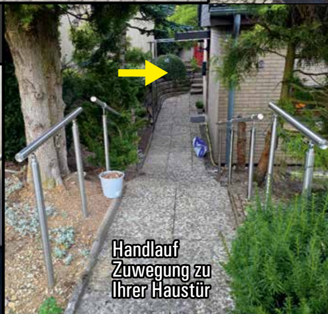
Handlauf Zuwegung zu Ihrer Haustür