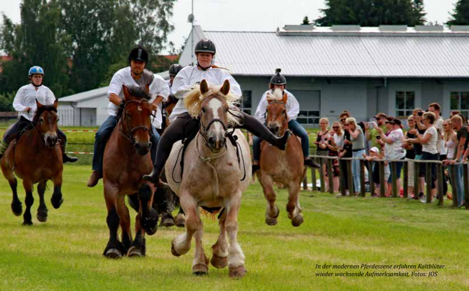
In der modernen Pferdeszene erfahren Kaltblüter wieder wachsende Aufmerksamkeit.