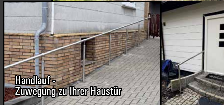
Handlauf - Zuwegung zu Ihrer Haustür