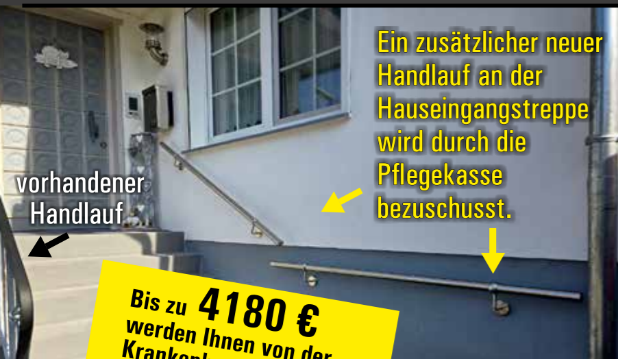
Ein zusätzlicher neuer Handlauf an der Hauseingangstreppe wird durch die Pflegekasse bezuschusst.