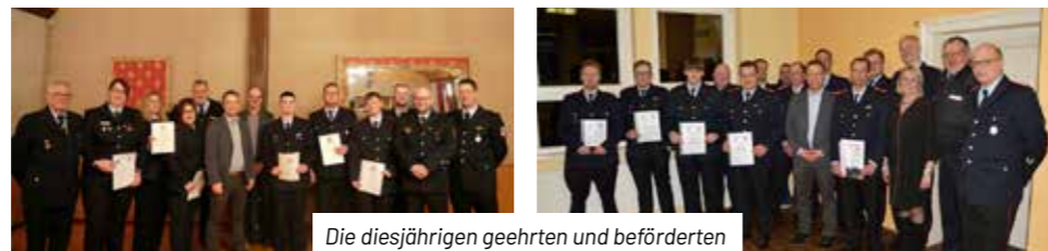
Die diesjährigen geehrten und beförderten Feuerwehrkameradinnen und -kameraden